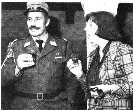
Auguro a tutti ogni bene per l'anno 1982 e che sia fatto bene tutto quanto dobbiamo fare per la difesa della nostra cultura.