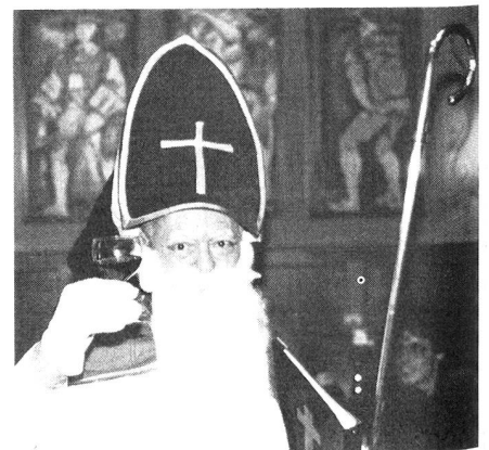
Auch der St. Nikolaus weiss einen guten Tropfen zu schätzen.