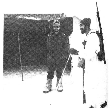
Sektion Bern: Einsatz mit SE-125

Seit dem 3. Februar 1982 ist das Basisnetz wieder auf Funkbereitschaft. Am 1. und 3. Mit-