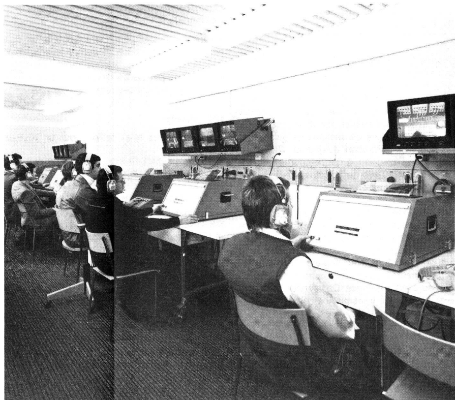
In der 2. Ausbildungsstufe arbeiten die Zentralisten in einem getrennten Raum. Die Instrukto-ren verfolgen die Arbeit der Zentralisten mit Fernsehmonitoren.

Trotz der vielen technischen Hilfen verlangt der Zentralistenkurs zu jeder Zeit ununterbrochen das vollste Engagement des Klassenlehrers. Die Hartnäckigkeit und «Präsenz» des Klassenlehrers entscheiden ganz wesentlich über das Leistungsniveau, welches die Klasse erreicht. Dass bei der hohen Arbeitsintensität, welche dieser Kurs dank ZA 77 und dank dem Einsatz von Videoüberwachung erreicht, der Instruktor mit seinen menschlichen Voraussetzungen, dem Einfühlungsvermögen, dem «Punch», dem Humor und dem beruhigenden Zureden ganz besonders wichtig ist, versteht sich von selbst. ●