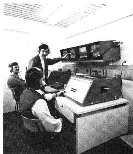
Der Klassenlehrer muss die Technik mit dem Menschen zusammenfügen und ist für die Ausbildung unersetzlich.

Es ist selbstverständlich, dass der Klassenlehrer die Zentrale «blind» bedienen kann, und dass er die Programmschritte ganz genau kennen muss, damit er die kritischen Ausbildungs-