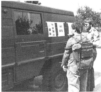
«Bilderrätsel» zur Übermittlungsübung GEBRI

Kursort: Bern Beginn: Jährlich im September Auskunft: 031 62 32 46 Anmeldung: Postfach 1348 3001 Bern