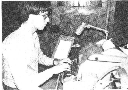
Zehnfingersystem und ernste Miene... dies beim fachtechnischen Kurs Stg-100

Es war nur allzusehr Zeit für die mitternächtliche Rückkehr bzw. für die schon bald folgende Tagwache.