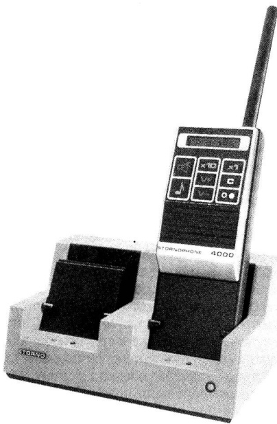
Das 2-Platz-Ladegerät kann 2 komplette Geräte oder 2 Akkus oder eine Kombination von beiden aufnehmen. Während des Ladens bleibt das CQP 4000 voll betriebsfähig.

Für das Stornophone 4000 wurde ein umfangreiches Tonrufprogramm konzipiert. Der Schwerpunkt liegt beim sequenziellen Tonruf nach ZVEI 1, 2, 3, EEA, und CCIR, wobei sieben Tonfolgen und Doppeltelegramme möglich sind. Zusätzlich kann das Gerät mit einem Pilotton CTCSS ausgerüstet werden. Gruppen-, Sammel- und Quittungsruffunktionen können zusätzlich programmiert werden. Beim eingebauten Tonsender können mittels dem Tastenfeld bis zu 100 Tonkombinationen eingestellt werden. Die verschiedenen Rufe werden im Anzeigefeld dargestellt.