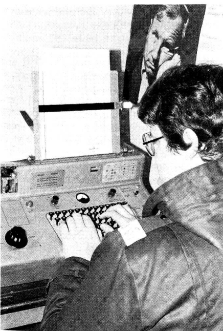
Ein Jungmitglied stellt auf dem Krypto-Funkferschreiber eine Verbindung zu einer andern Sektion her. Auf dem Manuskriphalter ist die Rufzeichenliste befestigt.

Nicht selten haben wir Verbindungen mit Bern, Neuenburg oder Thun, aber auch nähergelegene Sektionen wie Schaffhausen, Thurgau oder Uzwil sind unsere Partner.