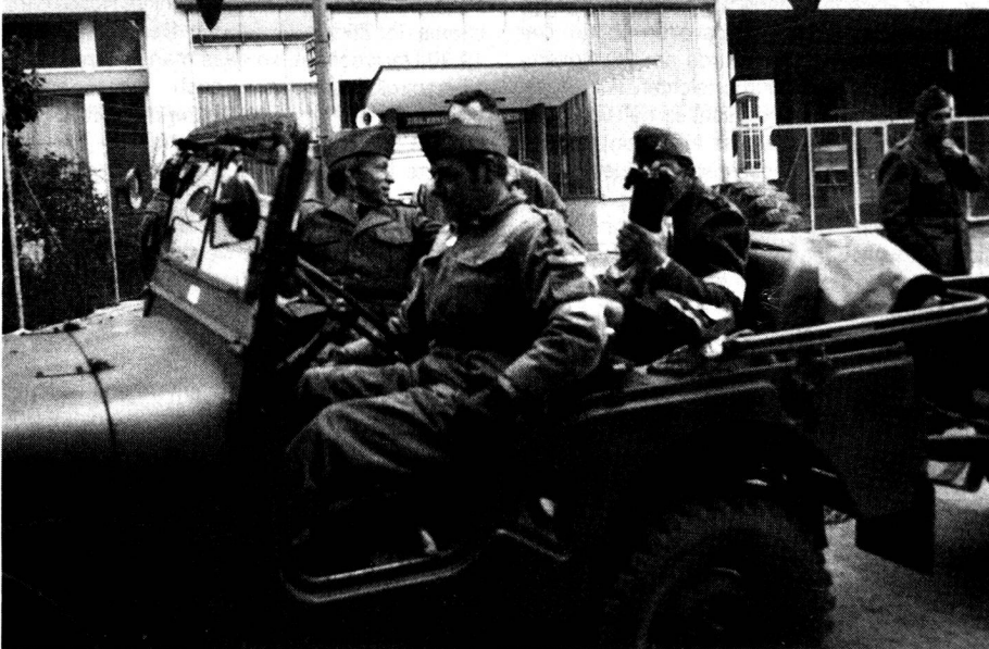
Motorisierte Funkpatrouille mit SE-125

Damit wir gezielt ausbilden konnten, wurde jede Sparte in zwei Gruppen aufgeteilt. Obschon die Instruktionszeit kurz begrenzt war, konnte das gesteckte Ziel erreicht werden. In einer letzten Phase, die als gemeinsames «Manöver» gedacht war, konnten alle Teilnehmer die Apparate bereits selbständig aufstellen und in Betrieb setzen. Da die einwandfreie Bedienung der Fernschreiber und der Zentralen eine grosse Routine verlangen, waren die ersten Gehversuche auch etwas zögernd.