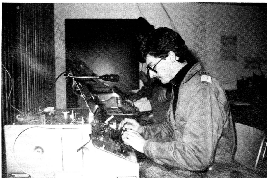
Während dieser grossangelegten Übermittlungsübung gelangten auch Krypto-Funkfernreiber (KFF) zum Einsatz.

Das Protokoll der letzten HV und der Jahresbericht des Präsidenten sind in der «Agenda» 4/83 abgedruckt und werden nicht mehr verlesen. Wir wollen damit den geschäftlichen Teil straffen und mehr Zeit gewinnen für das Rahmenprogramm. Dieses besteht aus einem Reisebericht über Moskau und Leningrad und einem kleinen Imbiss. Damit wir genügend davon