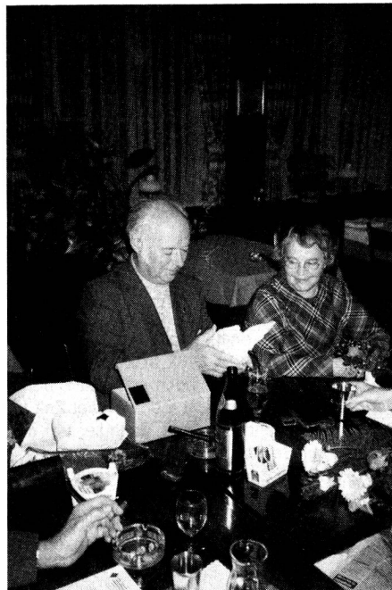
Veteranen beim gemütlichen Beisammensein.