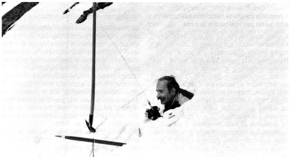
Vita di marmotta! Sotto si trova la «villa di 26 posti.