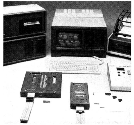
Philips-Entwicklungssystem-PMDS mit erweiterter Peripherie

Der modulare Schnell/Schönschreibdrucker PM 4492 ist mittels Kontrollsequenzen vollständig fernsteuerbar und verarbeitet auch Einzelblatt. Der universelle PROM-Programmer PM 4497 wird durch ein leistungsfähiges Low-costmodell (EP-408) ergänzt, das eine eigene Tastatur besitzt und auch ROM simulieren kann. Beide Programmer sind durch die PMDS-Software direkt unterstützt.