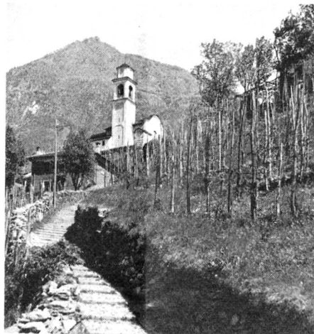
Kirche von Artore bei Bellinzona/Tessin

La plus ancienne et la plus grande des trois forteresses, le Castel Grande, possède de vastes installations de défense. Dès le VI e siècle, on la trouve mentionnée à plusieurs reprises dans des documents. L'immense cour, ouverte au public, servait certainement de refuge à la population. Des ruelles en pente mènent de la vieille ville à la colline du château, d'où l'on jouit d'une vue magnifique sur les toits