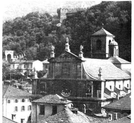
Renaissancefassade der Kollegiatskirche SS. Pietro und Stefano in Bellinzona, der Hauptstadt des Tessins.

Les samedis entre sept heures du matin et environ midi, le centre de la ville se transforme en un marché animé haut en couleurs. Les habitants font leurs emplettes, se rencontrent, discutent. Les touristes flânent le long des stands et admirent les étalages: fruits, viande, saucisses, fromages du val Muggio, de la Leventine et du val Maggia, pains de toutes sortes, mais aussi habits, souliers et objets manufacturés. Et il arrive souvent qu'un petit orchestre tessinois, une bandella, joue des airs populaires.