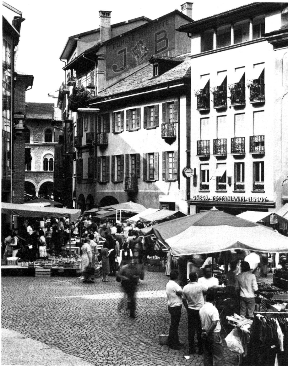
Markt auf der Piazza Collegiata in Bellinzona