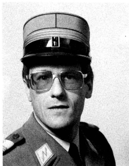
Hptm, Kp Kdt der Betr Kp I/6