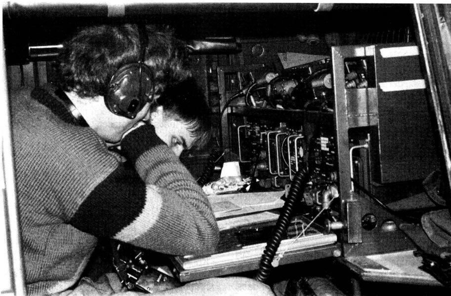
SE-412 im KP Luthern

Mitgeteilt vom Bundesamt für Übermittlungstruppen, Sektion Planung