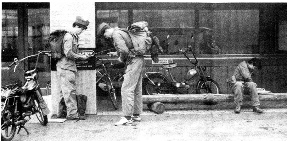
Vor dem Hallenbad Sumiswald

Es ist nicht die Wahrheit, die weht tut, sondern die plötzliche Erkenntnis Blick durch die Wirtschaft