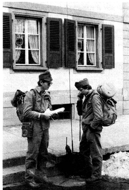
Patrouille in Wasen i. E. mit SE-227

Wir, Patrouille 8, mussten eine Kassierfrau von Sumiswald ausfindig machen. Eigentlich wäre damit die Kassenfrau vom Hallenbad gemeint gewesen. Dummerweise hatte es in der Nähe ein Kino und so stach ich in dieses Kino und flüsterte dem Fräulein das Passwort «Feuchter Frühling» ins Ohr. Dieses Fräulein, das ja keine Ahnung hatte, schaute zuerst verwirrt auf meine Uniform (die natürlich wie immer tadellos sass, alle Knöpfe geschlossen), dann schaute sie auf die Filmliste und meinte enttäuscht, diesen Film kenne sie nicht. Na ja, ich ging dann wieder nach draussen, und versuchte meinem Kollegen klar zu machen, dass hier wohl das falsche Fräulein sitze. Aber wir haben