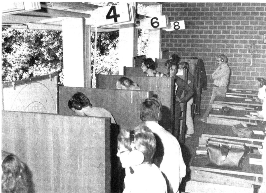
Eifriges Treiben auf allen acht Scheiben: Die Sektion Thurgau bei ihrem ersten Pistolenschiessen in Arbon