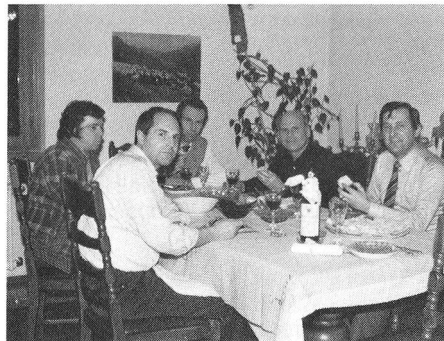
I membri del Comitato centrale si concedono un attimo di tregua per rifocillarsi.