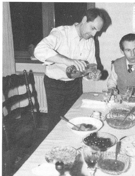
Il polso del Presidente è franco anche nella mescita.

E così chiacchierando un po' del pro e del contro, si trovano gli spunti per esporre alcune considerazioni e anticipazioni sulla nostra attività, che vi presentiamo in forma di «intervista al Presidente Centrale».