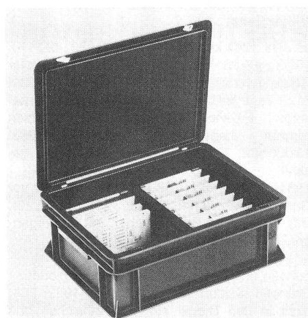
Leiterplattenbehälter aus leitfähigem Kunststoff bieten Schutz gegen mechanische und elektrostatische Einflüsse.

Die ideale Lösung dieses Problems bietet ein neuentwickeltes Leiterplatten-Behältersystem aus stabilem, elektrisch leitfähigem Kunststoff. Die genormten Systembehälter mit der Grundfläche 30x40 cm oder 40x60 cm sind in verschiedenen Höhen erhältlich und mit allen Eu-