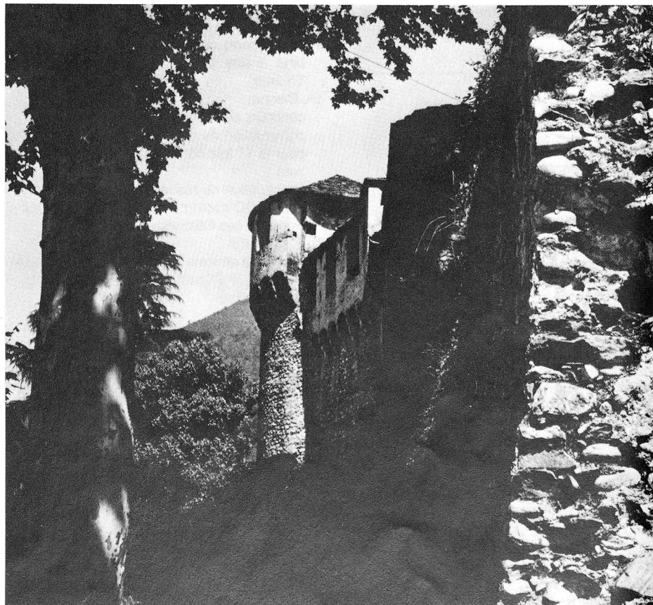
Il castello visconteo di Locarno che visiteremo