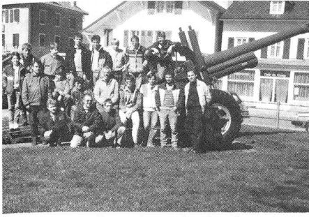
La traditionnelle «photo de famille» du dimanche à la fin de l'exercice.

Selon un protocole bien établi, ces jeunes ont effectué la traditionnelle course de patrouille à la carte dans la région de Longirod-Marchissy. La pratique de la boussole et de l'azimut dans le terrain n'est pas toujours évidente! Mais cette année, tout s'est très bien passé. Et la présence d'une SE-227 est rassurante.