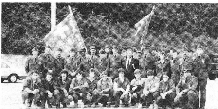
Siamo un'armata di pace, gioia, libertà

Sono sicuro che questi giovani hanno potuto usufruire delle esperienze vissute, le stesse approvate dai veterani che oggi guardano con soddisfazione ed un certo orgoglio questo «quadro».