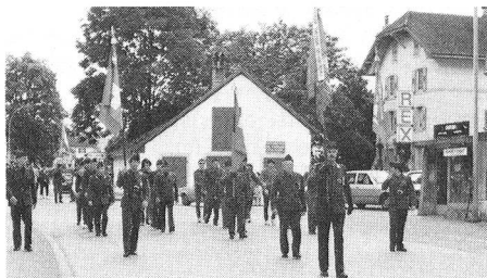
Tutti in fila

Durante i pasti e la festa «in famiglia» del sabato sera si è presentato un quadro bellissimo, dai colori giovani e vivaci, pieno di volontà ad incontrare il futuro.