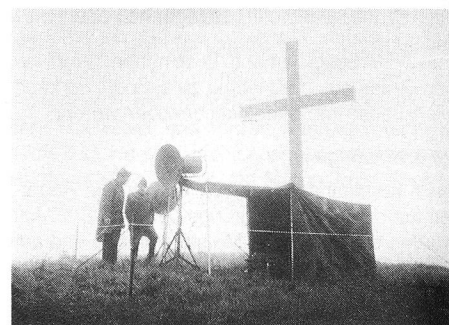
Gespensische Szenen spielen sich auf dem Wildspitz ab. Was verkabelt wohl der Köbi unter der triefenden Blache?

Es ist mir klar, dass dieser Bericht für Uneingeweihte stellenweise etwas unverständlich wirken mag. Deshalb hier noch ganz kurz, um was es an jenem 8. Juni überhaupt ging. Eine Katastrophe wurde im Raum Einsiedeln angenommen. Die Kantonspolizei Schwyz musste durch die Kantonspolizei Zug unterstützt werden. Zu diesem Zweck bauten die EVU Sektionen Uri, Zug, Glarus und Thalwil ein Kommunikationsnetz zwischen Zug und Schwyz auf, mit Relaisstationen auf dem Wildspitz (eben der mit dem Schnee, kein Witz), auf dem Albis sowie auf der Chrützwied oberhalb Einsiedeln (muuh!). Den aktiven und sozusagen katastrophal verregneten Teilnehmern und unserer Unterstützung aus dem Glarnerland möchte ich mit dem hier Niedergeschriebenen herzlich danken und hoffe, bei euch wieder einige Erinnerungen an jenen Samstag wachgerufen zu haben. Ein ganz besonderer Dank gebührt natürlich auch unseren Innerschwyzern Freunden, denn während ich diese Zeilen schreibe, schwebt ein saftig gegrilltes Kotelett vor meinem geistigen Auge. RK