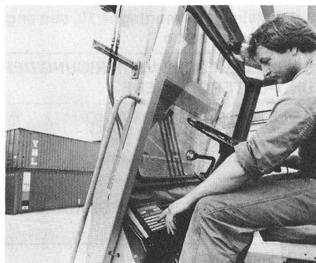
Der Datenfunk mit DIDACOM ermöglicht den direkten Zugriff zu Datenverarbeitungssystemen.

In der Gerätetechnik des Betriebsfunks (mobile und tragbare Geräte, Systembausteine) setzt man mehr und mehr Mikroprozessoren ein, die