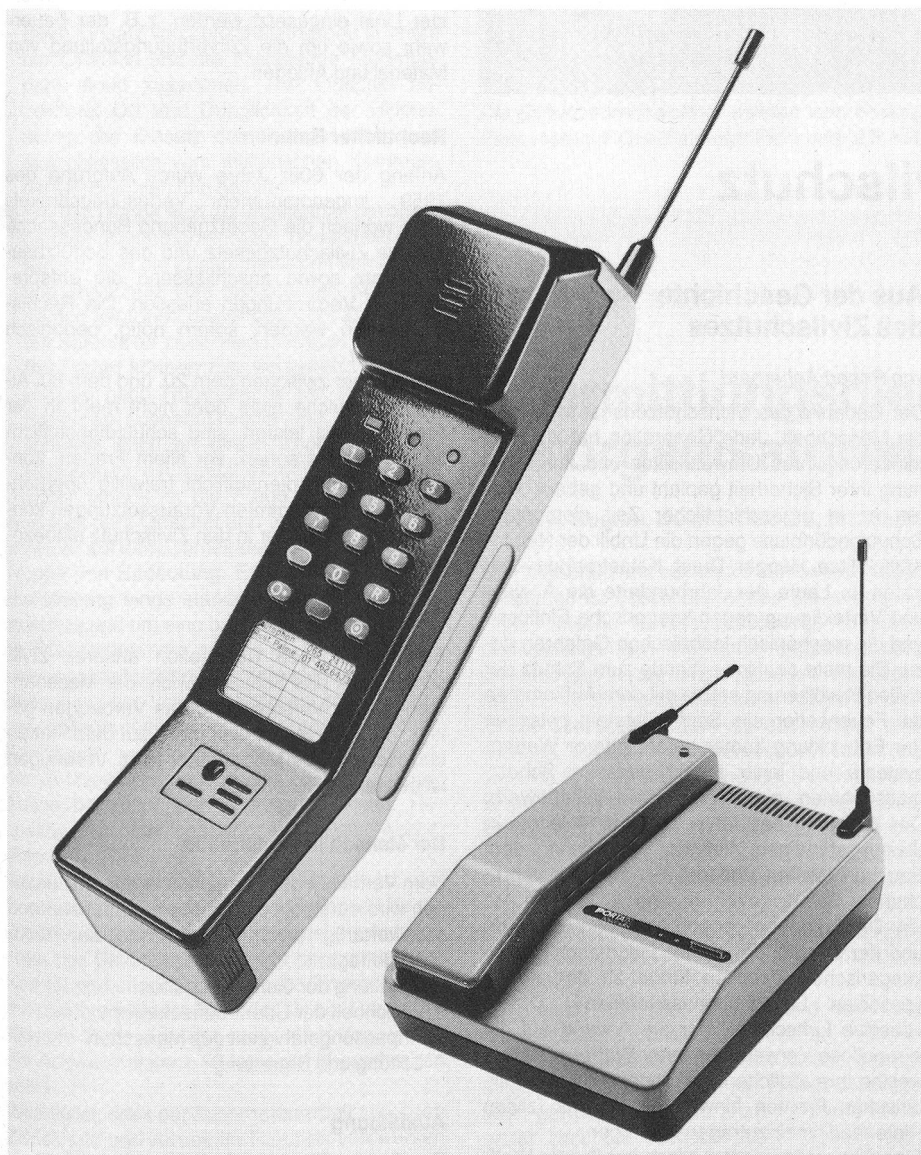
Das schnurlose Telefon PORTATEL arbeitet im 900-MHz-Frequenzband. Damit ist auch in Räumen eine optimale Sprechqualität gewährleistet.