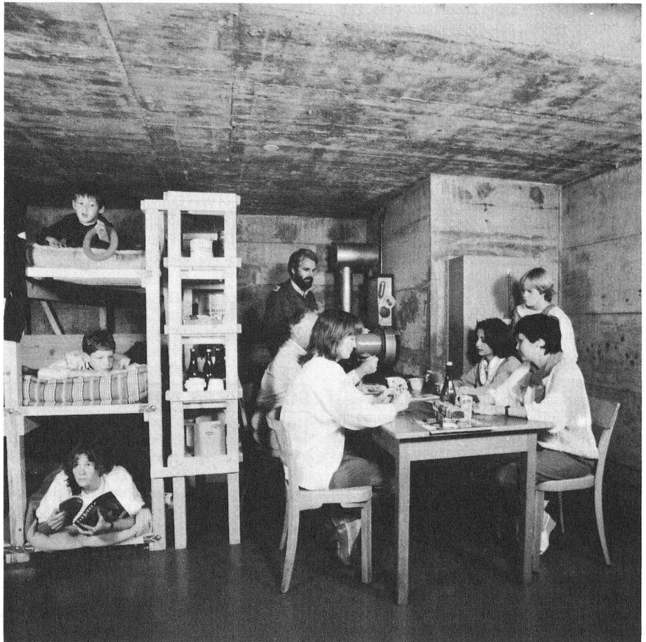
Die Schutzraumbewohner werden vom Schutzraumchef oder einer Schutzraumchefin betreut. Je Person steht 1 Quadratmeter Platz oder 2,5 Kubikmeter Raum zur Verfügung.

Wichtig ist, dass der Zusammenarbeit zwischen Zivilschutz und Armee im Rahmen von Kursen und Übungen (z. B. in Offiziers- und Gesamtverteidigungskursen) vermehrte Aufmerksamkeit geschenkt wird.