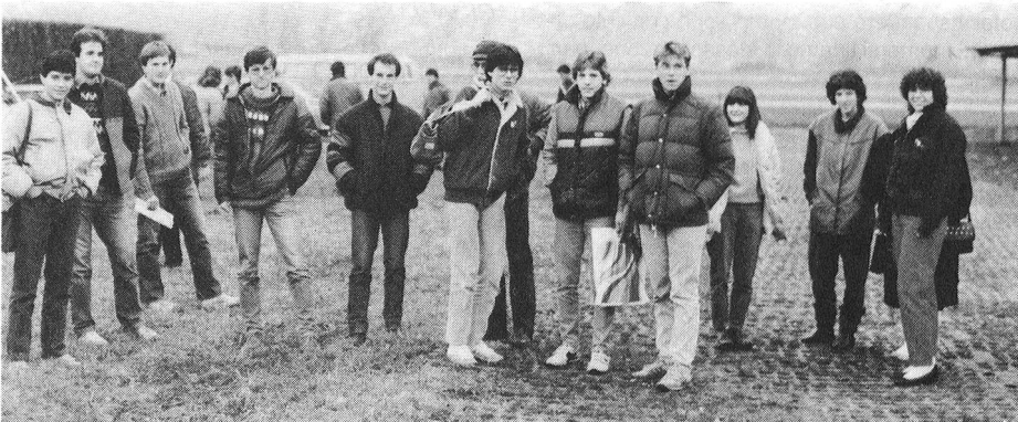
Entrata in servizio corso R902.