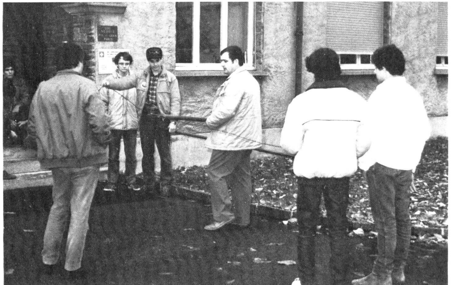
Prima il lavoro.

Altro avvenimento, ancora prima della Staffetta, sarà l'assemblea generale ordinaria, riunione alla quale attendiamo una massiccia partecipazione.