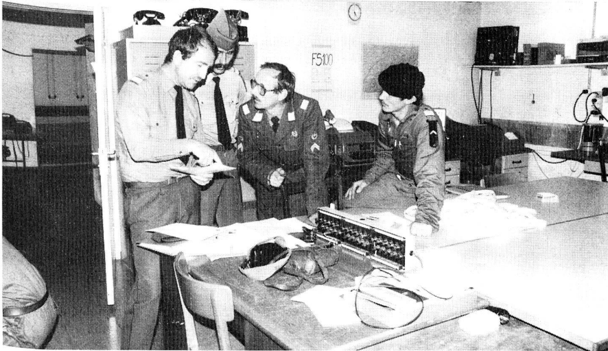
GIGARO 85: Sektions- und Gesamtübungsleitung besprechen die Lage.