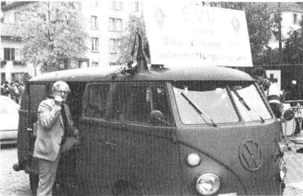
Unsere mobile Lautsprecheranlage.

Ferner musste wieder die Lautsprecheranlage aufgebaut werden, und zwar zuerst am Start und später im Zielgelände. Um dieses mobile Lautsprecherzentrum hat sich einmal mehr Hermann Portmann gekümmert.