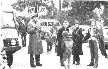
Zwei Netzleitstationen im Zielgelände.