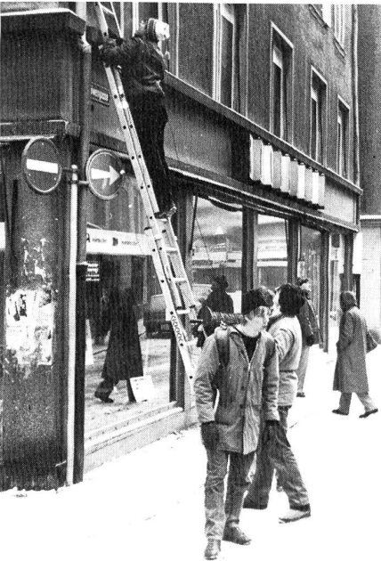
Leitungsbau für die Übung PEGASUS mitten in der Innenstadt von St. Gallen. Die Funkerkurschüler lernten so die Stadt auch von einer anderen Seite kennen.

Die grosse Teilnehmerschar versammelte sich um 8 Uhr bei einigen Minusgraden und nahm einen Lastwagen voll Material in Empfang, den Herr Frei vom Zeughaus eigenhändig steuerte. Mit einem Pinzgauer wurde nun ein Teil davon auf die Aussenstationen verteilt, damit sich auch dort die kalten Finger beim Aufbauen wieder etwas erwärmen konnten. Es verwundert wohl nicht, dass unter diesen klimatischen Bedingungen und mit den mehrheitlich unerfahrenen Teilnehmern die Betriebsbereitschaftszeit