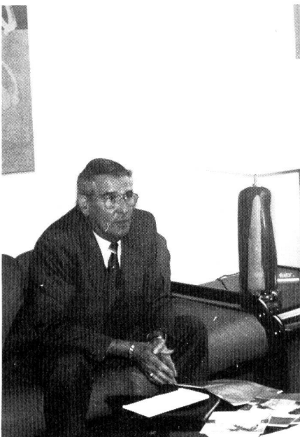
... dem PIONIER-Redaktor.