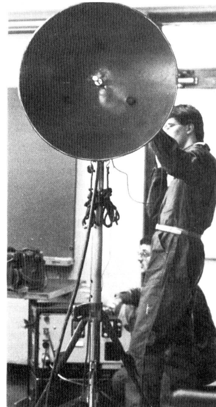
Fachtechnischer Kurs R-902/MK 5/4

Jährlich veranstalten wir einen bis zwei fachtechnische Kurse und ebensoviele Übermittlungsübungen. Die meisten werden über ein Wochenende, oft verbunden mit einer Übernachtung, durchgeführt. In diesem Bereich spielt auch die Zusammenarbeit mit den benachbarten Ostschweizer Sektionen sehr gut. Das gegenseitige Aushelfen bei Personalengpässen und gelegentlich gemeinsame Kurse und Übungen haben sich in den letzten Jahren eingebürgert.