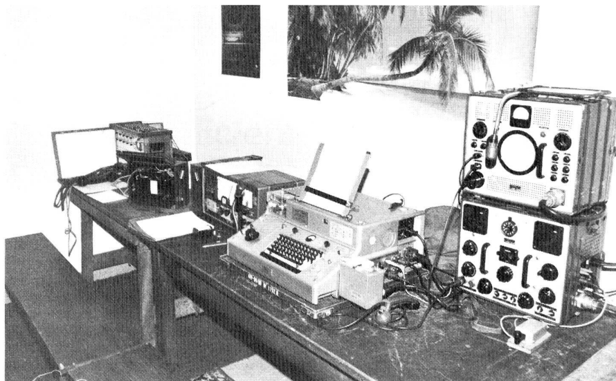
Basisnetz – Arbeitsplatz in Funklokal der Sektion St. Gallen-Appenzell

In den vier Schutzräumen von je ca. 20 m 2 Bodenfläche befinden sich die Basisnetzstation, ein Raum für Kurse usw., ein Kaffeestübel und das Materiallager. So gemütlich wie heute sah der «Bunker» am Anfang aber noch nicht aus. Erst im Herbst 1984 strichen wir in vieltägiger Abend- und Wochenendarbeit die grauen Betonwände mit heller Farbe. Eine separate Stromzuleitung musste erstellt werden, damit wir auch in Zukunft genügend «Pfuus» für Heizung, Beleuchtung und Funkstation zur Verfügung haben. Im gleichen Anlauf wurde das Telefon eingezogen, das wir heute nicht mehr missen möchten, denn Verbindungen zur Aussenwelt sind wichtig, wenn man immer am Ball bleiben möchte.