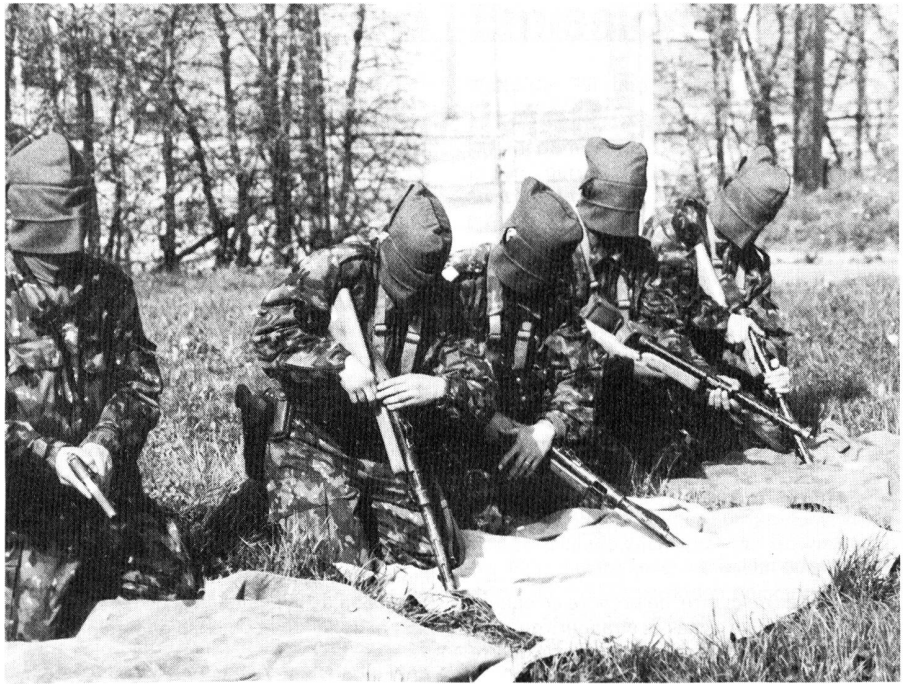
Démontages-remontages subtils avec une cagoule sur la tête Waffenausbildung an persönlicher Waffe und Kollektivwaffe

Der militärische Betreuungsdienst braucht Leute, die belastbar sind, die helfen (und die nicht selbst betreut werden müssen), die vor allem viel gesunden Praxisverstand mitbringen. Denn Üben ist für diesen Dienst ganz ausserordentlich schwierig und die kleinen Erfolgsergebnisse jedes Soldaten (Manöver, umgefallene Scheiben, Schiessen mit Kollektivwaffen usw.) sind kaum zu erreichen.