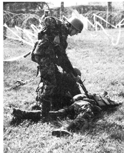
Protection des bâtiments importants Bewachung im Territorialdienst

Dans ce court délai il faut d'un côté les introduire dans les domaines spécifiques, de l'autre côté il faut aussi leur apprendre le maniement des armes, la protection contre les armes chimiques ou l'art d'établir un constat d'accident.