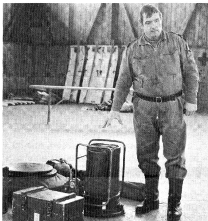
«Sowenig Theorie wie nötig, aber nicht weniger!»