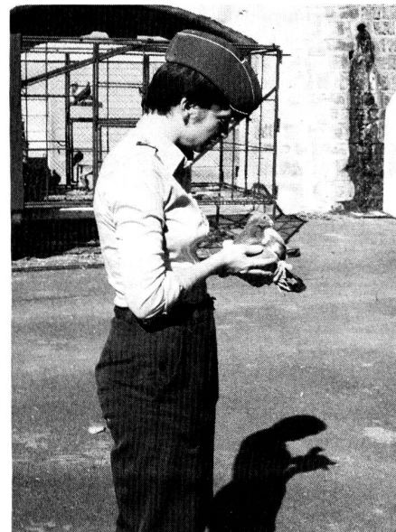
Attrazione principale: i piccioni viaggiatori

Un sentito ringraziamento va alla direzione dell'UFTRM e a tutte le organizzazioni che hanno offerto il loro aiuto all'ASTT per l'organizzazione di questo riuscito esercizio.