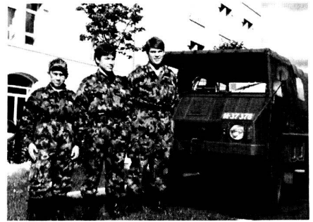
De futurs juniors vaudois

biles lorsqu'on voit notre croix fédérale et le pourpre qui l'entoure remplacés par du noir. S'agit-il de voitures de «la zone», d'un agrandissement du volatil qui prend tout l'emblème (parfois même le noir occupe les deux emblèmes) un coup de Vigilance, un incognito partiel, une préparation à une indépendance de la République et Canton? A Aoste, ce sont les anciennes plaques qui étaient noires, mais portaient le fanion, à FL, idem. Des explications avant qu'on voie... rouge!