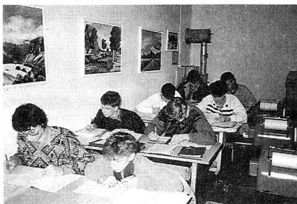
Die Kursteilnehmer bei der Prüfung über den Starkstrombefehl.

Zurzeit steht der Starkstrombefehl auf dem Kursprogramm. Dabei geht es darum, dass jeder angehende Übermittlungssponier eine Leitung anhand der Masten identifizieren kann und weiss, ob und wie er in der Nähe solcher Leitungen Truppenleitungen bauen darf. Ebenfalls muss er auch Auskunft geben können, wie hoch die Spannungen dieser Leitungen sind. Im weiteren geht es darum, was zu tun ist bei einem Starkstromunfall.