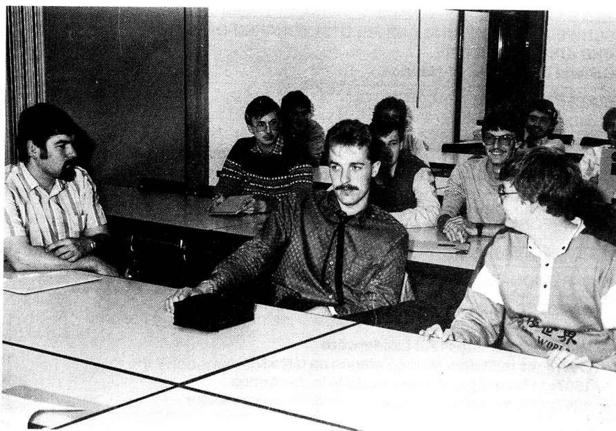
Au cours radio pré-militaire, des jeunes attentifs et dévoués.

Des efforts vont prochainement être entrepris pour mieux se faire connaître et recruter de nouveaux membres. A cet effet, une manifestation réunissant des CiBistes de Romandie nous a demandé de présenter les transmissions militaires le samedi 19 mars à Monthey. Nul doute que nous ferons des émules parmi ces jeunes passionnés de communications radio.