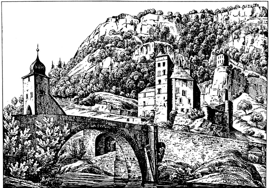
Gravure anonyme: Le pont de Saint-Maurice entre 1831 et 1847. Association du Vieux Saint-Maurice.

Unter der Nummer 35 ist in der Serie der «Cahiers d'archéologie romande» im vergangenen Herbst zum Anlass des 200. Geburtstags des Generals ein hervorragend gestaltetes Werk erschienen. Das reich illustrierte Buch mit dem Titel «Le Général Dufour et St-Maurice» verdanken wir der Zusammenarbeit folgender Stellen: Bibliothèque historique vaudoise, Direction