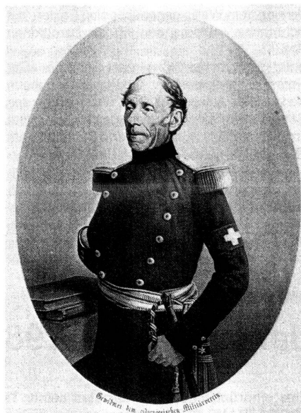
Le général Dufour. Gravure de Perron (Musée militaire de Colombier).