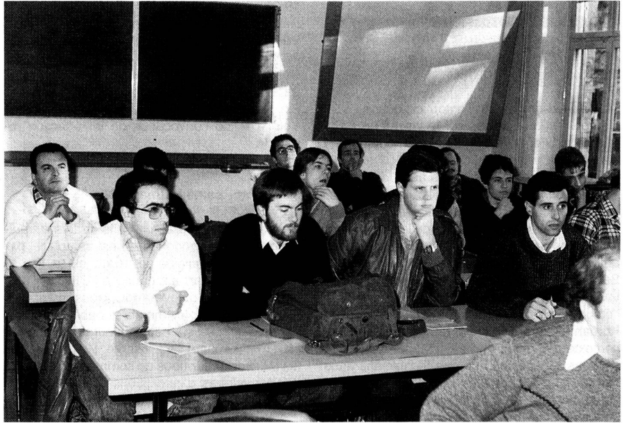
Una classe attenta.

Per la SE 227/412, solo fonia, esiste una piccola giunta digitalizzata e la SE 225 è in prova; se ne stanno vagliando i risultati.