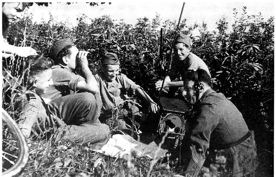
Mit dem Velo am Übermittlungsstandort eingetroffen...