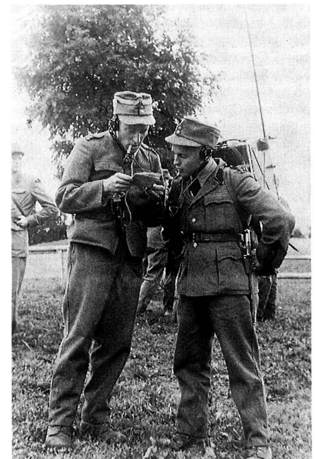
Unterwegs zu einem Übermittlungseinsatz

Im Gegensatz zu vielen anderen Sektionen des EVU, die sich im Verlaufe ihrer Vereinsgeschichte von der jeweiligen UOG abgelöst haben, ist der EVU Zürichsee rechtes Ufer auch weiterhin eine Untersektion der Unteroffiziersgesellschaft. Die Zusammenarbeit mit der UOG klappt dabei vorzüglich und bringt nach meiner Meinung für beide Seiten nur Vorteile: So werden unsere Mitglieder mit dem Beitritt zum EVU automatisch auch Mitglied der UOG und geniessen so auch die Möglichkeit, am jeweiligen Tätigkeitsprogramm der Muttergesellschaft teilzunehmen. Umgekehrt führen wir natürlich immer wieder gerne die Übermittlung an den Anlässen der UOG durch, insbesondere am alljährlichen Nachtpatrouillenlauf im Herbst. So hoffen wir auch weiterhin auf eine fruchtbare Zusammenarbeit mit der UOG.