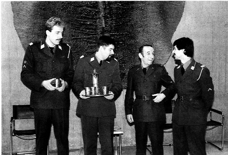
Die Arbeit unter dem Jahr hat sich bezahlt gemacht: Einige der Gewinner

Die Delegiertenversammlung wählt den Zentralpräsidenten, den Vizepräsidenten, den Zentralsekretär und neue Mitglieder des Zentralvorstandes einzeln und die übrigen zur Wiederwahl stehenden Mitglieder des Zentralvorstandes gemeinsam. Im übrigen konstituiert sich der Zentralvorstand nach Massgabe der zu lösenden Aufgaben selber.