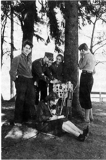
Schon in den Anfangsjahren beteiligten sich auch FHD (heute MFD) an der Übung

Auch weitere Übermittlungsdienste zugunsten anderer Vereine und an verschiedenen Sportanlässen werden uns vielfach durch die UOG vermittelt.