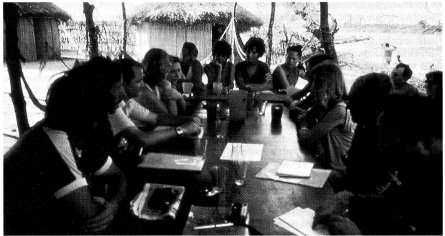
Teambesprechung am Rand der Wüste.

Es ist unbestritten, dass neben der technischen Ausrüstung auch gewisse organisatorische Grundlagen notwendig sind, damit die Übermittlung im Katastrophenfall einwandfrei funktionieren kann. Praktische Erfahrungen konnten in dieser Hinsicht an SKH-Übungen gesamt-