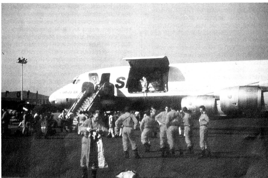
Ankunft im Einsatzgebiet.

Als vollends untauglich für die Bedienung durch Nichtfachleute erwies sich die ARQ-Einrichtung. Die Beherrschung des Zusammenspiels dieser der Computertechnik nahestehenden Geräte mit der Kurzwellenstation erfordert eine gewisse praktische Erfahrung im Umgang mit