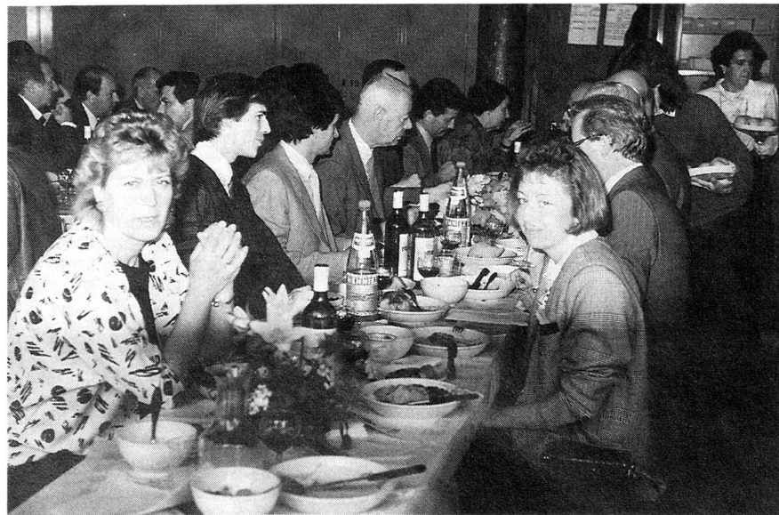
Decoroso anche il pranzo.

Sicuramente non tutti inizieranno il 1° settembre, come coloro che si danno da fare nel settore dell'insegnamento, ma le vacanze vengono, se è possibile, organizzate nell'ambito dell'andamento scolastico, come abbiamo fatto anche nella nostra società, ci ritroviamo dopo