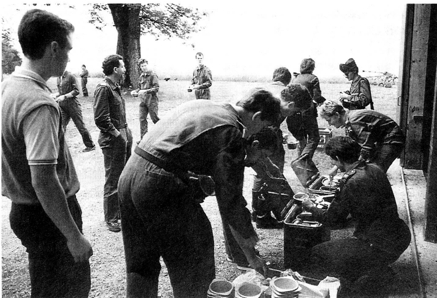
Die Übungsteilnehmer beim Fassen der Verpflegung aus der Militärküche.

Dann, im Sinn der Übungsleiter geht der «OL» alsbald weiter. Man darf nach Koordinaten seinen neuen Standort raten.