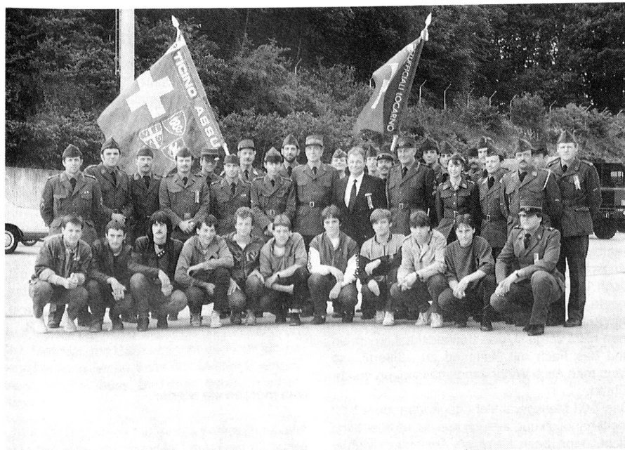
Ci sono tutti.

Dalla Redazione e dal vostro baffo vi giungano i migliori auguri per un luminoso Natale ed un felice fine d'anno.