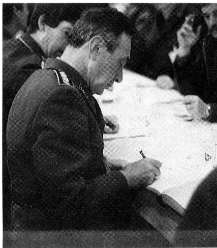
Col Cdt di corpo d'armata R. Moccetti.

È una crudele verità, spesse volte, quella di dover segnare il tempo che passa dicendo: «C'era una volta». Spesso, però, si tratta di meriti che il tempo preserva all'uno o all'altro. Così mi rivolgo ai nostri comandanti dai gradi più alti che con il loro impegno e il loro senso di responsabilità hanno dedicato il loro tempo ad una difficile, delicata ma assolutamente valorosa attività che valorizza la nostra neutralità rinforzando lo stato democratico nel quale abbiamo la fortuna di vivere. Il Col Cdt d'armata R. Moccetti, alla testa del 3° corpo d'armata, termina il suo mandato alla fine di quest'anno.