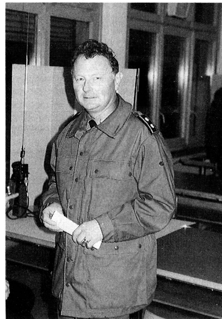
Col Div W. Zimmermann assume altre responsabilità.

danti valorosi ammirati in particolare dal semplice soldato, di aver udito espressioni di orgoglio da parte di una larga schiera della popolazione ticinese nel sapere questi generali alla testa di importanti grosse unità d'armata. Voglio indirizzare a questi stimati cittadini-soldati un sincero grazie e tanti auguri per il tempo del meritato riposo militare.