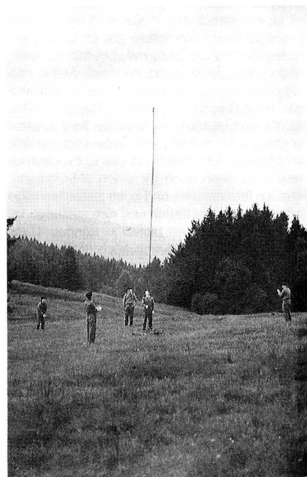
Mit einiger Mühe wird der neun Meter hohe Antennenmast gestellt – bis er schliesslich doch gerade steht.

Auf dem Hirschberg zwischen Gais und Appenzell kam es zum ersten praktischen Arbeiten mit dem Material. Das Funkgerät und die diversen Zusatztaschen wurden dabei eingehend erklärt und besprochen. Daraufhin wurde gemeinsam eine Dipolantenne aufgestellt. Hierbei entfalten die Teilnehmer ihre ganze Kreativität und verliehen dem 9m hohen Mast allerlei geschwungene Formen. Schliesslich stand er aber doch noch leidlich gerade. So konnte ein Gerät angeschlossen werden, und der klare Empfang einer Kurzwellenrundfunkstation belohnte die Anwesenden für ihre Arbeit. Um das Gelernte noch zu vertiefen, mussten zwei weitere Antennen gestellt werden. Diesmal waren die Gruppen jedoch nur halb so gross wie zuvor, so dass jeder einmal praktisch zum Einsatz kam.