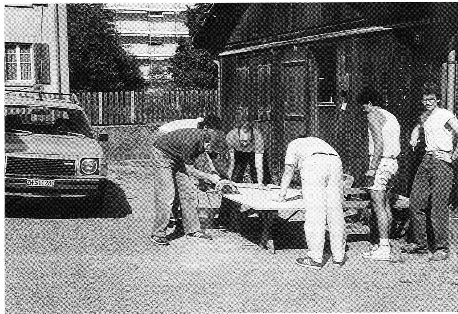
Bauen ist mit Arbeit verbunden