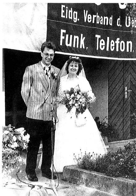
Herzliche Gratulation an die Neuvermählten

An dieser Stelle wünscht die ganze Sektion St. Gallen-Appenzell den Frischvermählten alles Gute für die Zukunft, und mir bleibt nur noch, Fritz für die Einladung recht herzlich zu danken. mm