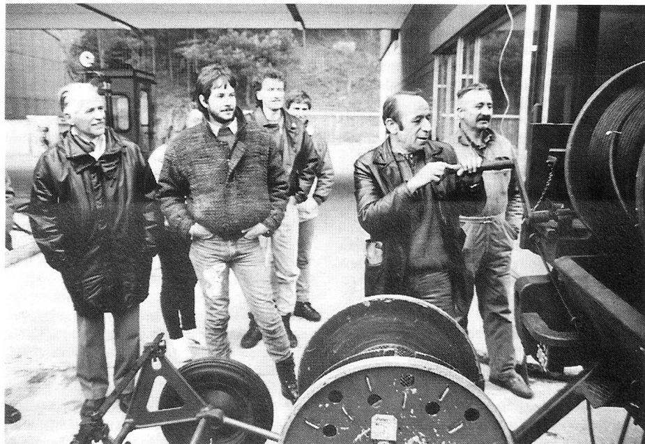
Le président de la section Valais-Chablais présentant la remorque de câble F-20.