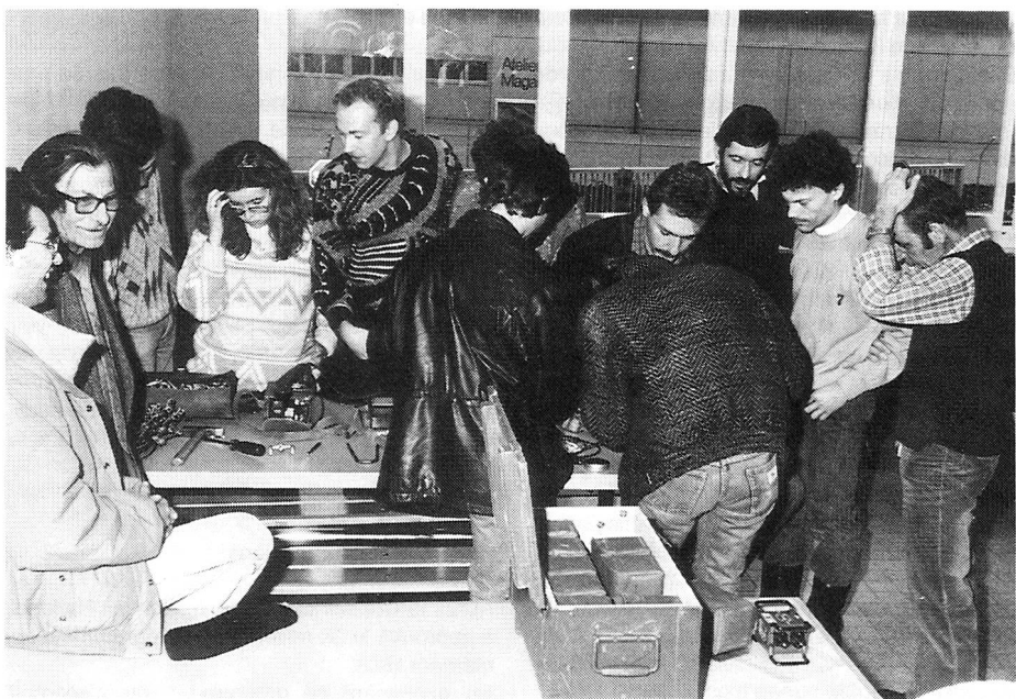
La technique de réparation du câble de campagne a retenu l'attention de tous.