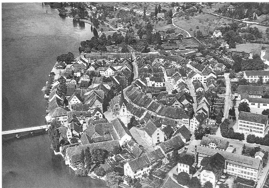
Das Städtchen Stein am Rhein und das OK DV 89 freuen sich auf Ihren Besuch!