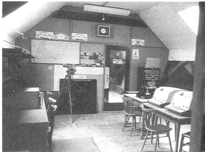
Une vue partielle du local de section.