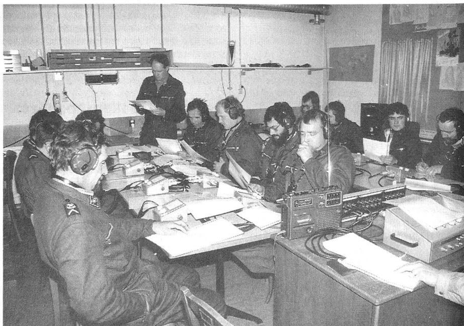
Frischten ihre Kenntnisse im Sprechfunk auf: die Teilnehmer des Open Door-Kurses.

war unsere Sektion mit einer Delegation von 4½ Mitgliedern vertreten. Der «halbe» Delegierte hatte leider das Pech, auf dem Bahnhof