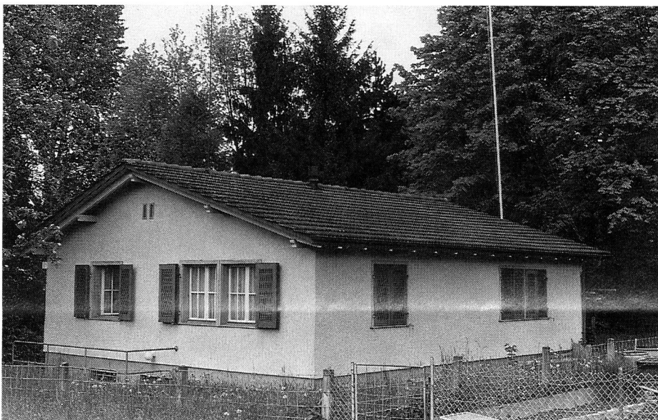
EVU-Eigenheim nahe dem Tierpark in Langenthal.

Die EVU-Sektion Langenthal ist zugleich Sektion des Unteroffiziersvereins (UOV) Langenthal. Momentan sind 10 Aktivmitglieder eingetragen.