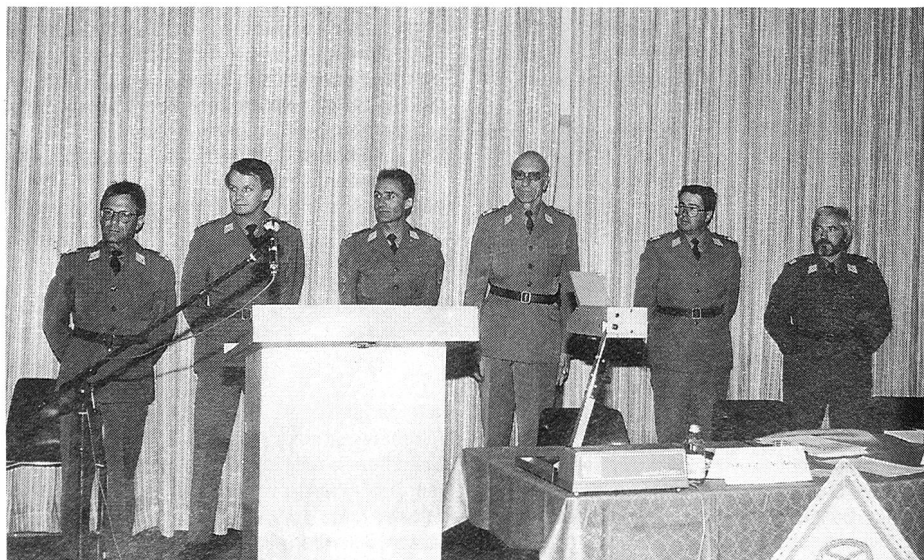
Le nouveau président central (2e depuis la gauche) avec le comité sortant.

Über die anlässlich der Hauptversammlung behandelten Geschäfte wird zu gegebener Zeit im Protokoll berichtet.