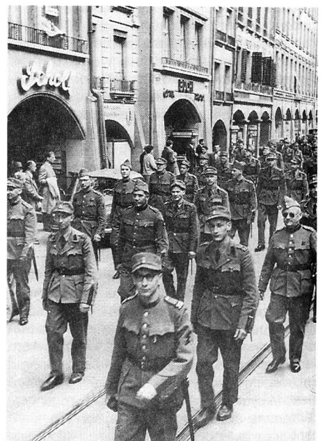
Ein Teil der Sektion beider Basel am 25. Jubiläum in Bern 1952.

Unsere Sektion zählte nun – nach dem Zweiten Weltkrieg – bereits bald 20 Jahre, ging also der «Volljährigkeit» entgegen. Wie viel gab es über die «Jugend» zu schreiben! Und jetzt... bzw. dann...? Die geruhsamen Jahre kamen. Der Verein war konsolidiert und in eine Zeit hineingewachsen, da sachlich und fachlich gearbeitet werden konnte. So nahmen auch wir teil an alljährlichen Übermittlungsübungen, fachtechnischen Kursen aller Art sowie am permanenten Übungsnetz, solange wir unser Pi-Haus benutzen konnten.