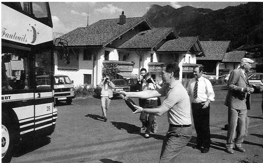
Cartaufe in Beckenried.