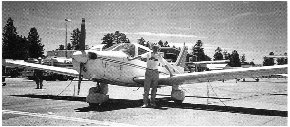
Le vent est tel que l'on est obligé d'amarrer les avions par des chaînes, sous les ailes.