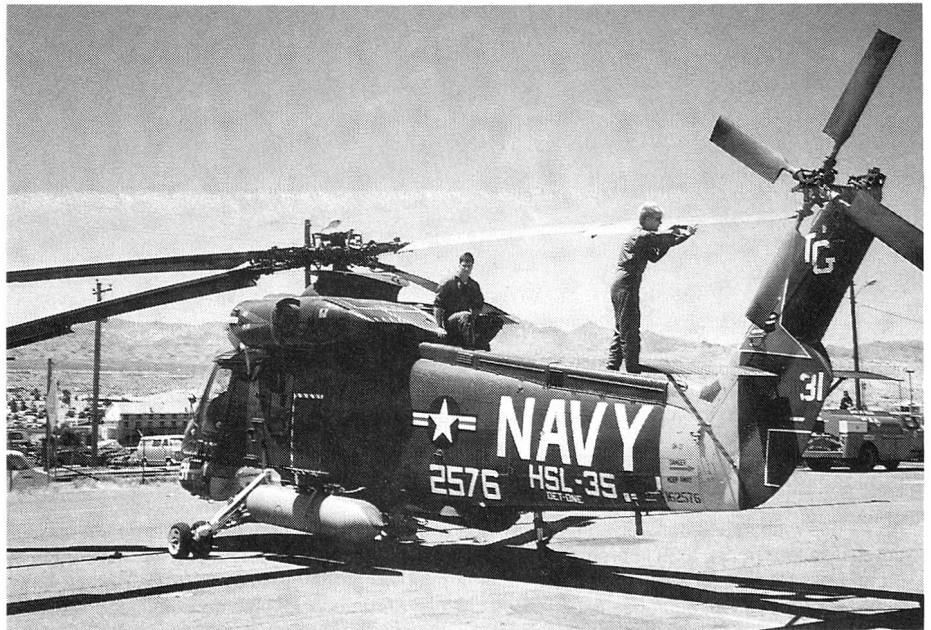
Exercice de maintenance pour l'équipage de cet hélicoptère, chasseur de sous-marin.