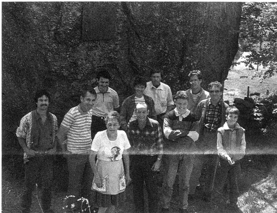
L'équipe participant à l'exercice devant la «Pierre à Marconi».