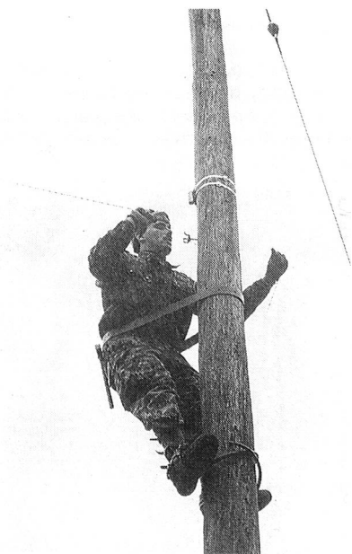
La construction de lignes dans une région fortement bâtie exige des connaissances techniques étendues et beaucoup d'entraînement.

La construction des lignes est assurée normalement par des groupes de construction à pied. Selon les priorités, les différentes compagnies peuvent être renforcées par les moyens mobiles de la compagnie d'état-major du régiment de soutien. Les membres du service des transmissions font partie des spécialistes indispensables. Ils portent avec fierté l'éclair à leur col!