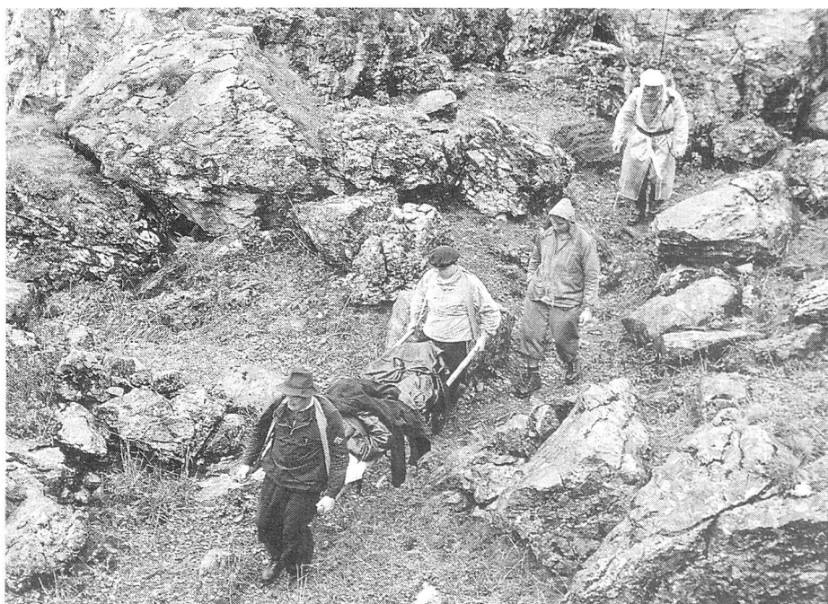
Thurwies, Oktober '57.

10. Juli: Absturz am Hinterrugg: ein Schwerverletzter.