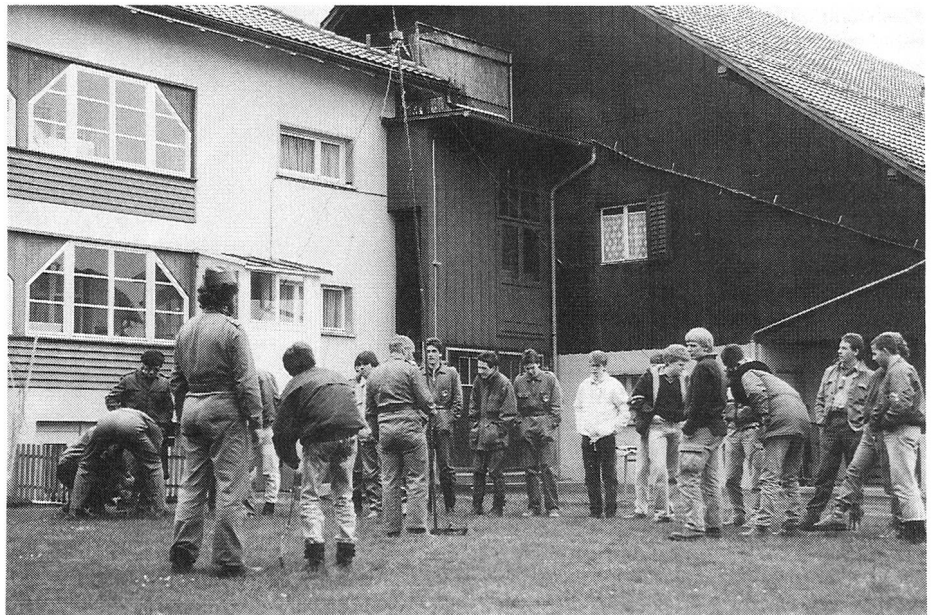
Zusammenhalt: Alle Generationen (Veteranen, Aktive, Jungmitglieder und zugewandte Pfadfinder) interessieren sich für den Fachtechnischen Kurs.