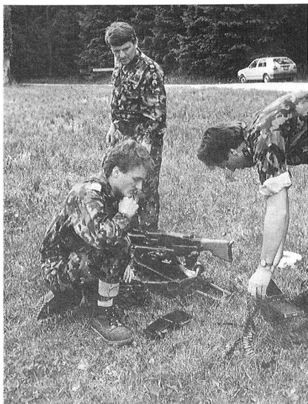
Zur Ausbildung eines Übermittlers gehört auch die Verteidigung der Station. Gemeinsame Übung mit dem UOV Thurgau.

Die beschleunigte Evolution der Technik im Bereich der Übermittlung trug das Ihre dazu bei, dass der Ausbildung an neuen Geräten der Grossteil der Zeit eingeräumt wurde. Ohne grössere Unterbrüche erscheint in den Annalen der Sektion die