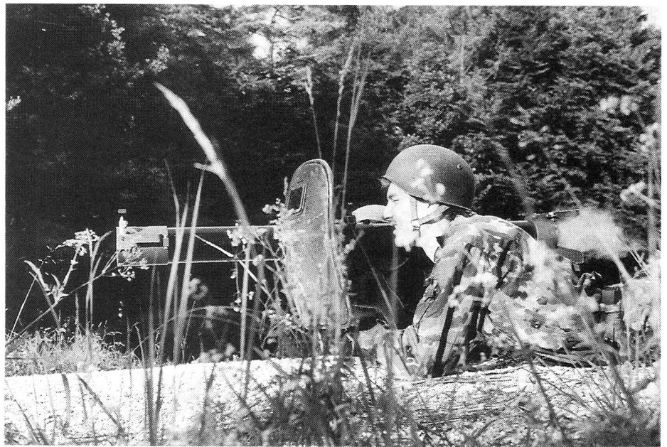
Besondere Attraktion sind Übungen, bei denen nicht nur Übermittlungsgeräte eingesetzt werden.

Nachdem sich die Sektion voll hinter das neue Konzept der Katastrophenhilfe EVU stellt, ist eine Anzahl der kommenden Anlässe (fachtechnische Kurse SE-902/Mk-5/4 und Übungen) vorgegeben. Es bleibt aber noch ein breites Betätigungsfeld für alle Jung-, Aktiv- und