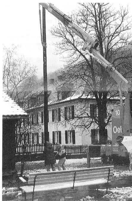
Die Ölwehr stellt Masten

Welche ökologischen Schweinereien macht wohl der EVU, dass die Ölwehr zum Einsatz aufgeboden wird? Zum Glück keine, wie unschwer auf dem Bild ersichtlich ist. Es war den guten Beziehungen von Peter zu verdanken, dass wir für das Stellen des Mastes die Hilfe der Feuerwehr Baden mit ihrem Kran beanspruchen konnten.