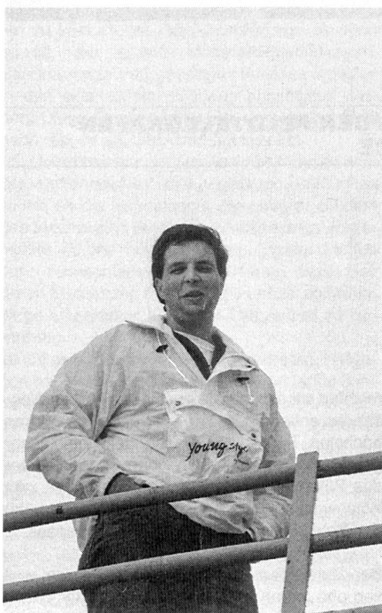
Con buon umore verso il 1990.