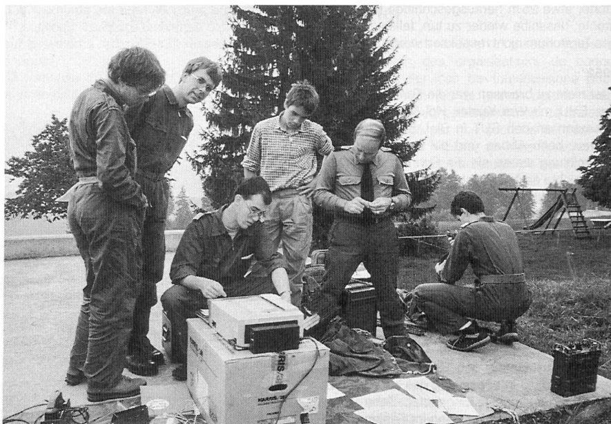
Grosses Interesse am Telefax, Übung «Quintett» 1989.