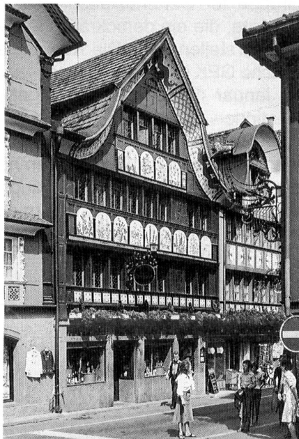
Hauptgasse in Appenzell.

Die konfessionelle Spaltung führte namentlich in Innerrhoden zu einer Abschliessung, ja sogar zu Erscheinungen der Inzucht. Die Kleinheit der Appenzeller ist heute noch sprichwörtlich, aber in Wirklichkeit längst überholt. Die Innerrhoder Bevölkerung umfasst etwa 13 000 Einwohner, so dass fast jeder jeden kennt. Die Zahl der einheimischen Familiennamen ist aber mit knapp 80 so klein, dass diese zur genauen Bezeichnung einer Einzelperson in der täglichen Umgangssprache nicht immer genügen. Das Geschlecht der Manser ist mit rund 1000 eingetragenen Familien in Innerrhoden das grösste. Um die über zwanzig verschiedenen Emil, Jakob, Josef usw. auseinanderzuhalten, bedient man sich ihrer Spitznamen, die grundsätzlich erblich sind. Sie bilden ein sehr interessantes Stück lebendiger Kultur- und Sprachgeschichte. Selbst die höchsten Landesbeamten werden vom Volk immer noch, ohne die geringste Einbusse ihrer Würde, mit ihren Spitznamen benannt.