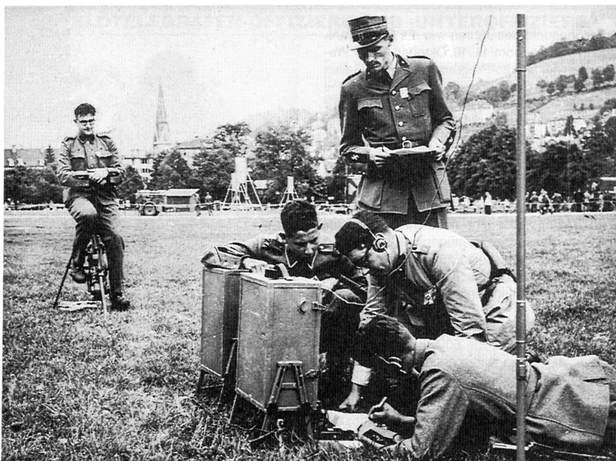
Tretgenerator statt Hometrainer – aus der Steinzeit der Militärfunkerei.

Die neue Fernschreiber-Funkstation erfüllte die in sie gesetzten Hoffnungen nicht. Zudem machten verschiedene Defekte die Einsendung der Apparaturen ins Zeughaus nötig. Übrigens machten auch andere Sektionen die gleich schlechten Erfahrungen. Auch mit den Morsekursen war es nicht zum besten bestellt: «Die