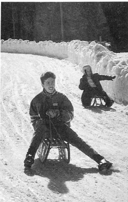
Swen in voller Fahrt, hinunter ins Tal.