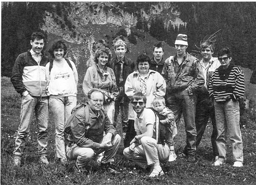
Auf dem Gamplüt (Wildhaus).