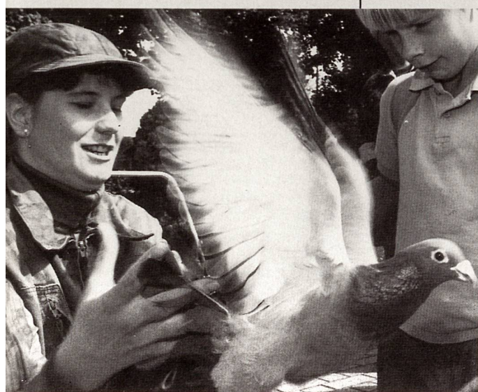
«Tarantella» Bft Vrb Plan, Phase DUE

50 Jahre FHD/MFD: MFD-Fest in Winterthur